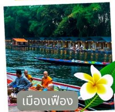
เมืองฟุ้ง