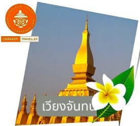
เวียงจันทน์