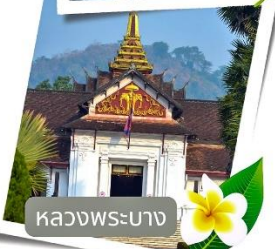
หลวงพระบาง