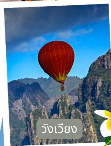
วังเวียง